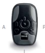
01 Micro Holter (A 48 x L 29 x P 12 mm)