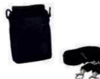
01 bolsa em neoprene para o gravador