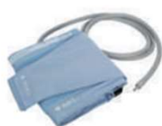
1 manguito tamanho G + 1 capa de manguito tamanho G