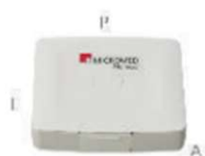
01 gravador de Holter Nomad (15 x 70 x 80) mm (A x L x P)