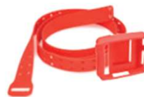
01 kit cinto e case de silicone (01 cinto + 01 extensor + 01 case para gravador holter Nomad)